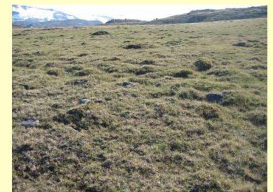
Masarsuk aputip aattuarfia