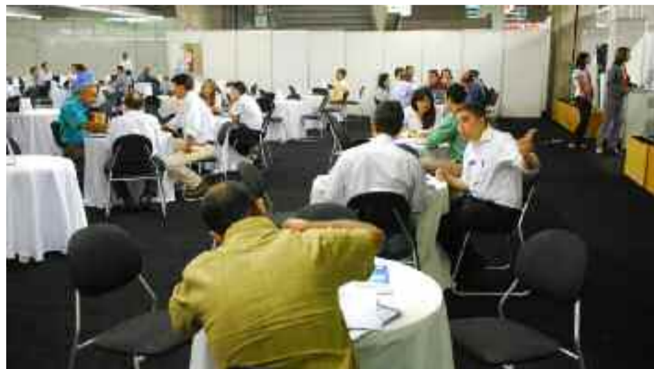
... a ForInd é ótima oportunidade para novos negócios

As quatro empresas foram a Metalúrgica Atlas, a Centelha, a Digi-tron e a CALF Calçados.