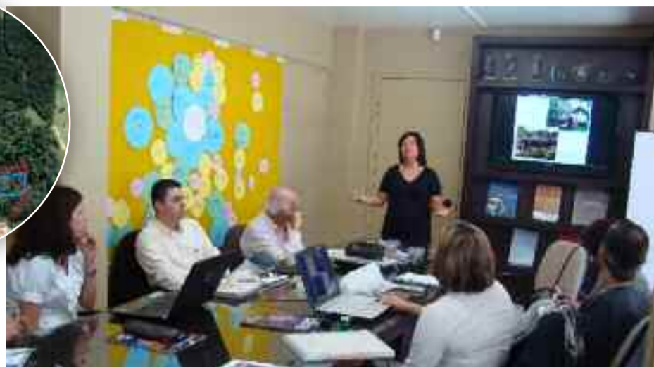
● No detalhe, em vermelho, a área do Parque Ambiental; em azul, as estações do Centro de Educação. Acima, oficina no Centro de Educação e Conservação da Natureza