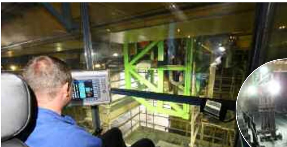
Operador na cabine da nova ponte rolante

A sacagem de pinos na Fábrica de Poços de Caldas é uma atividade que, antes, necessitava da presença de um operador em cima do passageiro da cuba. Com a chegada da ponte rolante do projeto New Soderberg , totalmente automatizada, foram disponibilizadas melhores condições de trabalho para a equipe da Sala de Cubas, principalmente no que diz respeito à segurança e à tecnologia. “A nova ponte rolante é um marco para Poços de Caldas. O começo certo de uma nova era, devido ao grau de automação, precisão e conforto que ela proporciona”, enfatiza Affonso