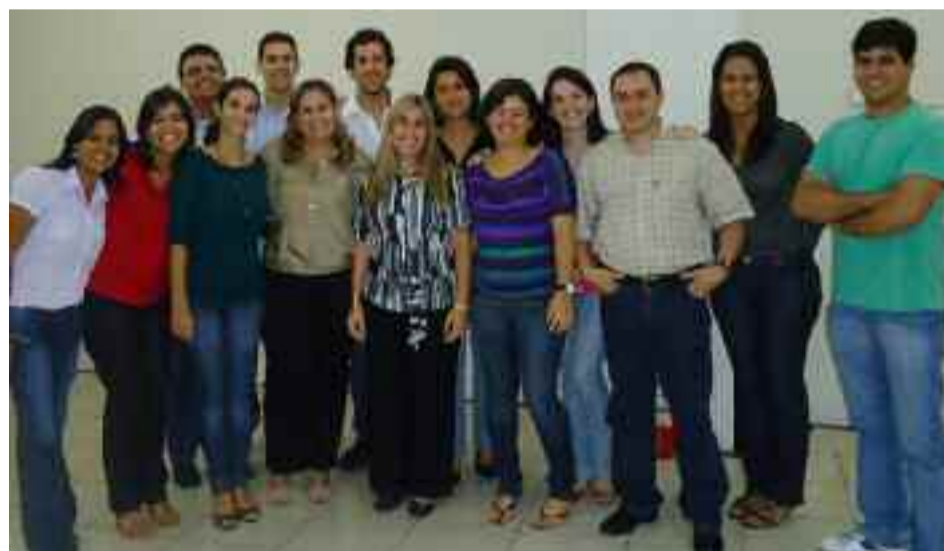
Equipe do Pilar de Qualidade, Processo e Produção no Ciclo de Projetos e Melhoria Focada

O Pilar é formado por um grupo de pessoas das áreas de Qualidade, Processo e Produção e tem como missão principal trabalhar de forma sistemática, disseminando a cultura do controle de processo, por meio da utilização de ferramentas de gestão para redução de perdas por Qualidade. Um de seus principais papéis é dar o suporte aos Projetos de Melhoria Focada na aplicação dos roteiros de