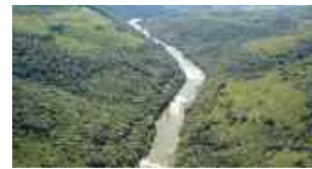
● Rio Pelotas, onde será construída a barragem da Hidrelétrica de Pai Querê

Como grande destaque, o estudo avaliou que muitas espécies de flora e fauna existentes na área de interesse do aproveitamento hidrelétrico estão presentes também em áreas próximas que não serão influenciadas pela futura usina. O próximo passo é a realização de três audiências públicas, para obtenção da Licença Prévia, documento que atesta a viabilidade ambiental do empreendimento.