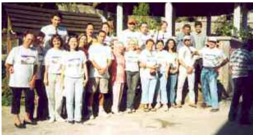
● Ação comunitária realizada em 2002 no Asilo Madre Teodora, em São Paulo