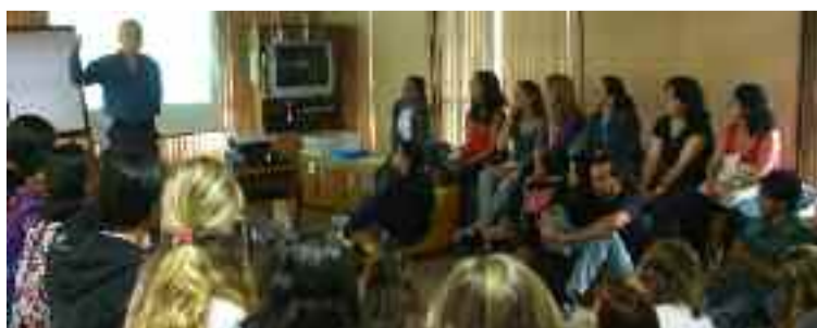
● Capacitação: professores participam de curso no Parque Ambiental

No encerramento do curso foi lançado um concurso para a escolha do projeto mais sustentável, que receberá uma doação de recursos do Instituto Alcoa para a sua implantação.