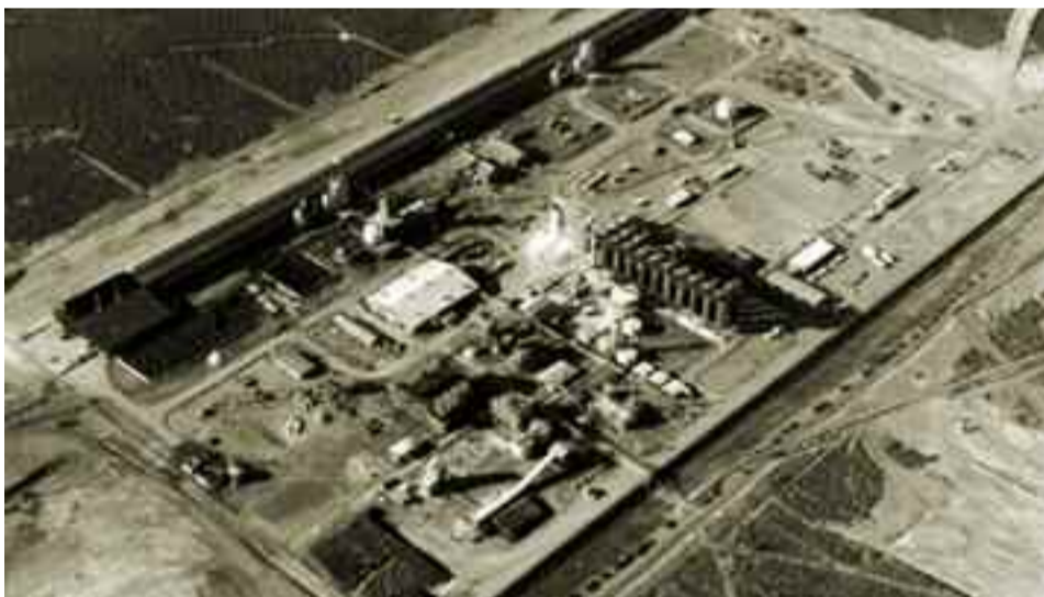
● Obra concluída em 1970

Uma fábrica construída em 1965 em Poços de Caldas-MG foi o início no País da Alcoa América Latina e Caribe, hoje presente em nove estados brasileiros, com operações também em Suriname, Jamaica e Trinidad & Tobago, e que emprega mais de sete mil funcionários ● Página 3