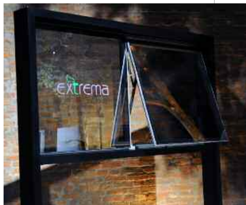
● A Linha Extrema, sistema de esquadrias com vidro colado, é fácil de montar e tem design diferenciado