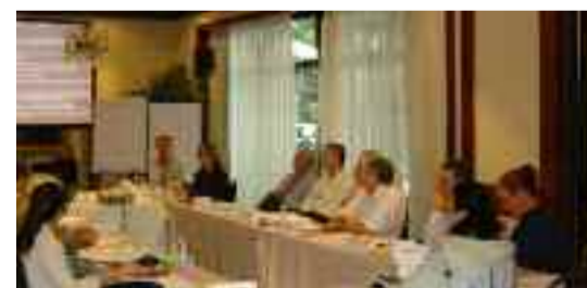
● Reunião de Planejamento Estratégico