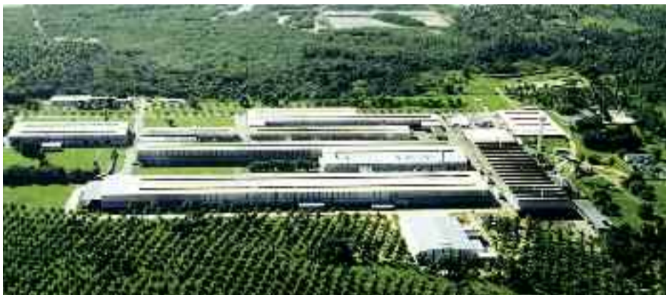
● A Unidade de Itapissuma tem 17% de sua demanda de gás suprida após o leilão