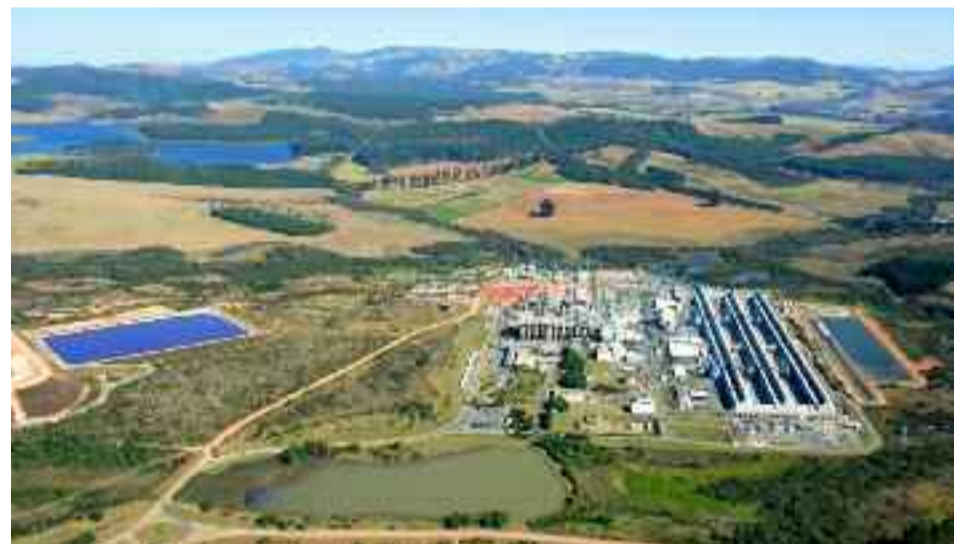
● Poços de Caldas hoje