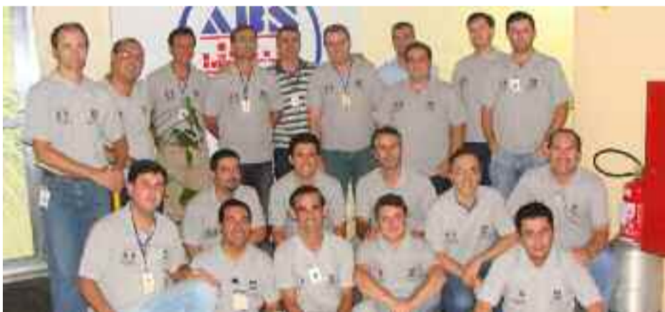
● Time de participantes do Workshop SSMA em Utinga