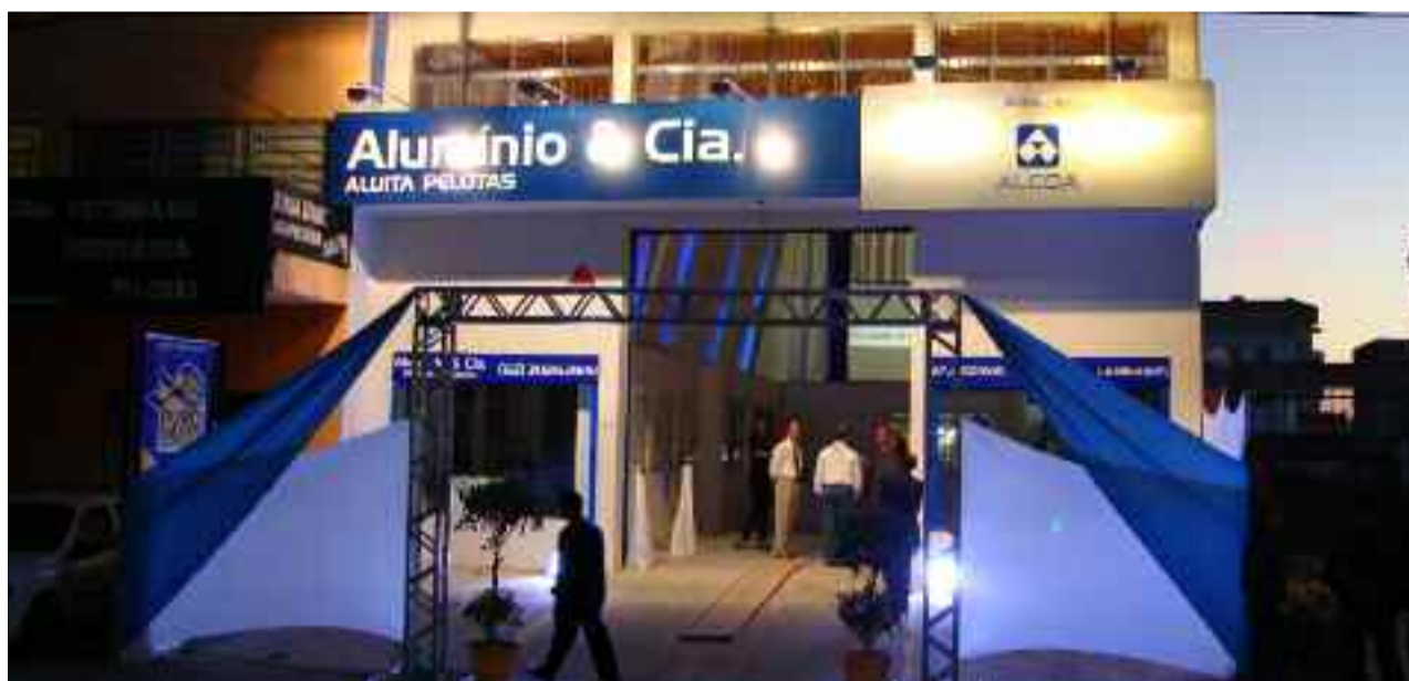
● A loja Aluítia, de Pelotas-RS, uma das 22 da Rede Alumínio & Cia. que serão inauguradas até o fim do ano

As próximas lojas cujas inaugurações estão confirmadas, ainda este ano, são as de Pelotas-RS, Cuiabá-MT, Palmas-TO, Marabá-PA, Porto Velho-RO, Garanhuns-PE, Campina Grande-PB, Juazeiro-BA, Mossoró-RN e outras.