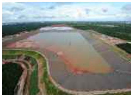
● Vista da Área de Resíduos de Bauxita 5

Outro pioneirismo da obra foi a utilização do Syncro, ferramenta de planejamento que