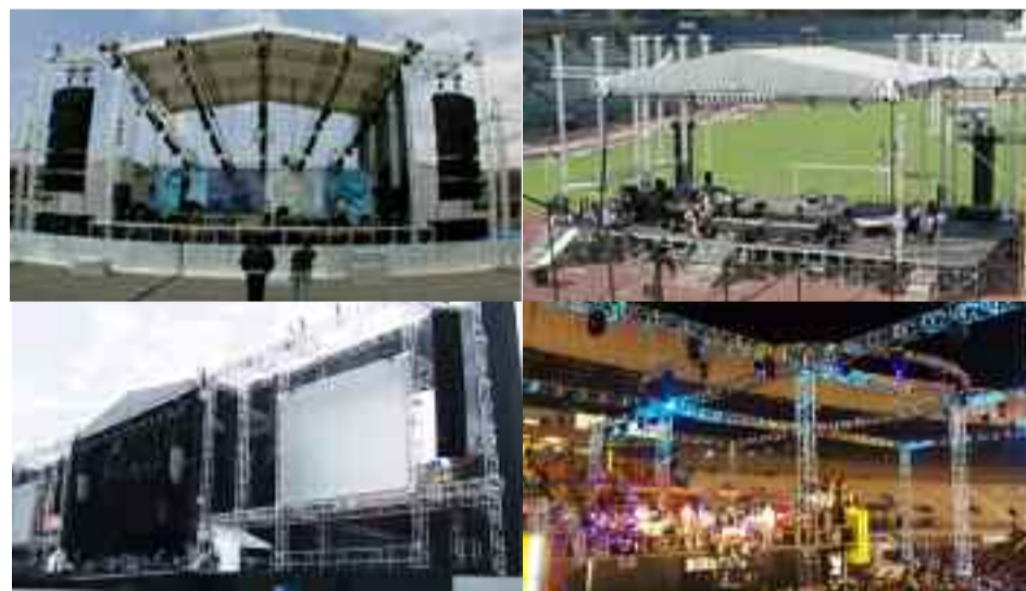
● Estruturas e palcos de alumínio na liga 6082 usados pela Feeling Structures

por produção, o que acarretava em constantes atrasos nos fornecimentos e prejudicava as pretensões de obtermos um market share