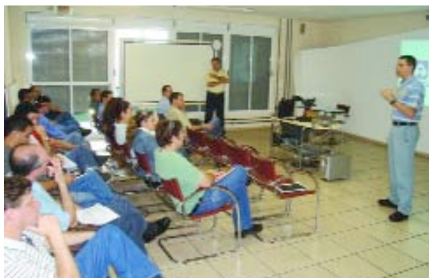
> ALINHAMENTO | Equipe do treinamento do Gerenciamento Diário e da metodologia do A3 de Solução de Problemas