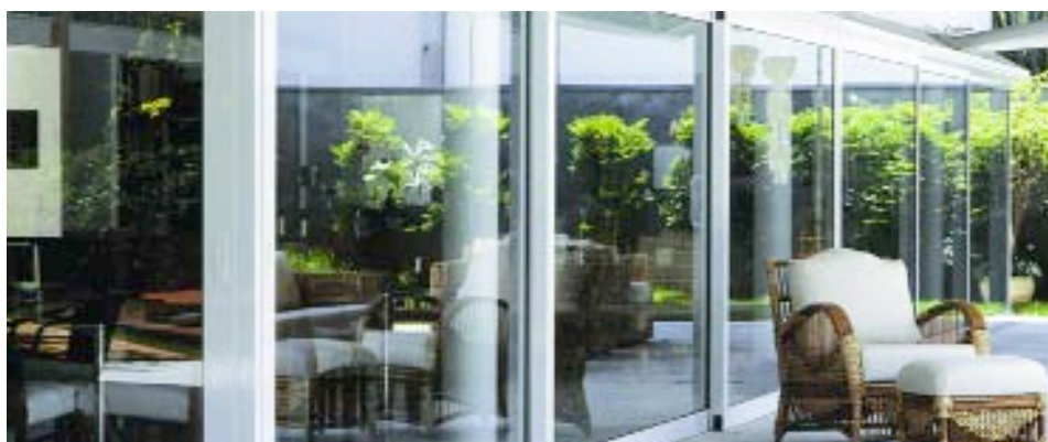
> ACABAMENTOS | Perfis pintados em obras de construção civil