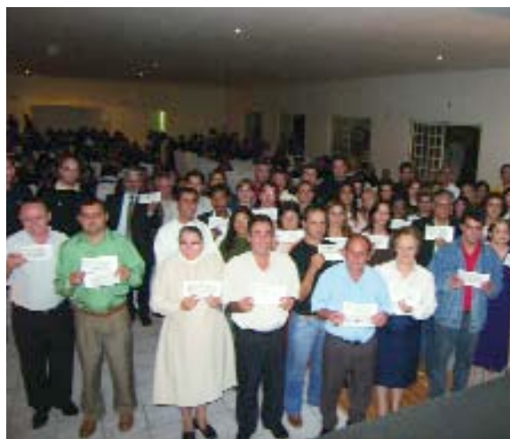
> AFL DO BRASIL