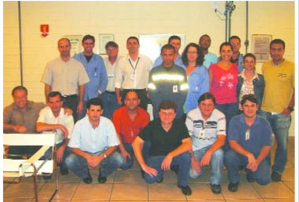
> TUBARÃO | Participantes do workshop A3 de Soluções de Problemas