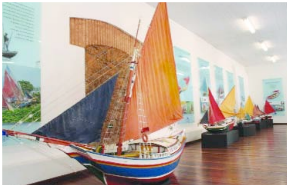
> HISTÓRIA | Réplicas de embarcações no museu do CVT-Centro Vocacional Tecnológico

Além das atividades educacionais, o Estaleiro é um dos mais novos pontos turísticos de São Luís. Com um rico acervo arquitetônico, o CVT possui um museu com livros, ferramentas ligadas à arte naval maranhense e réplicas de embarcações.