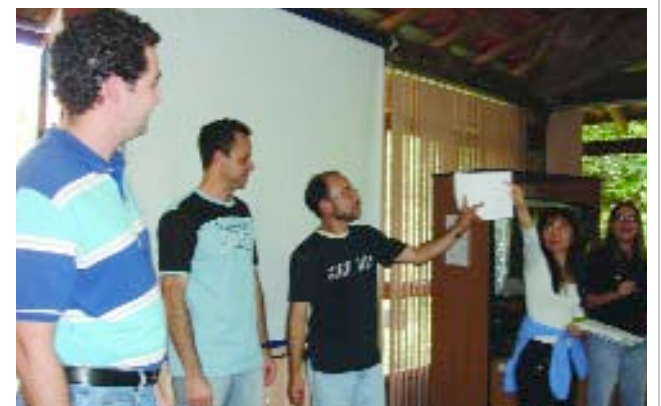
> POÇOS DE CALDAS | Grupo do treinamento do Pensamento A3