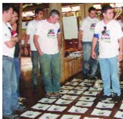
> PARTICIPANTES | Uma das atividades desenvolvidas no programa