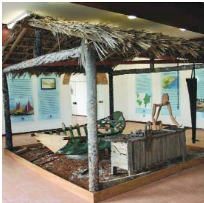
> SALA ESPECIAL | Local que ilustra as origens da arte maranhense