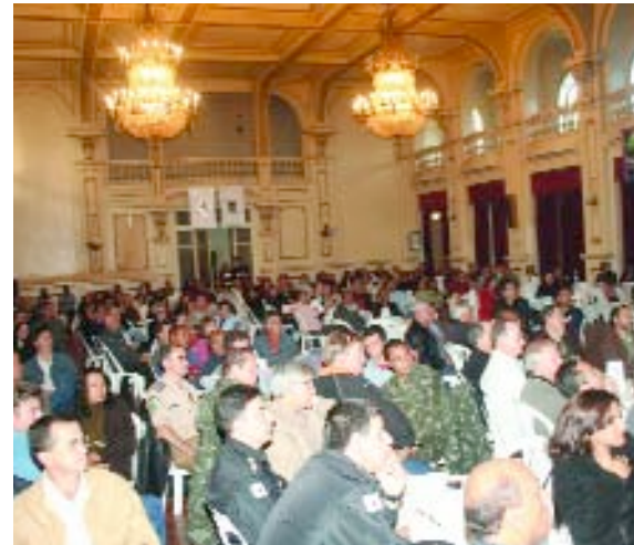
> POÇOS DE CALDAS