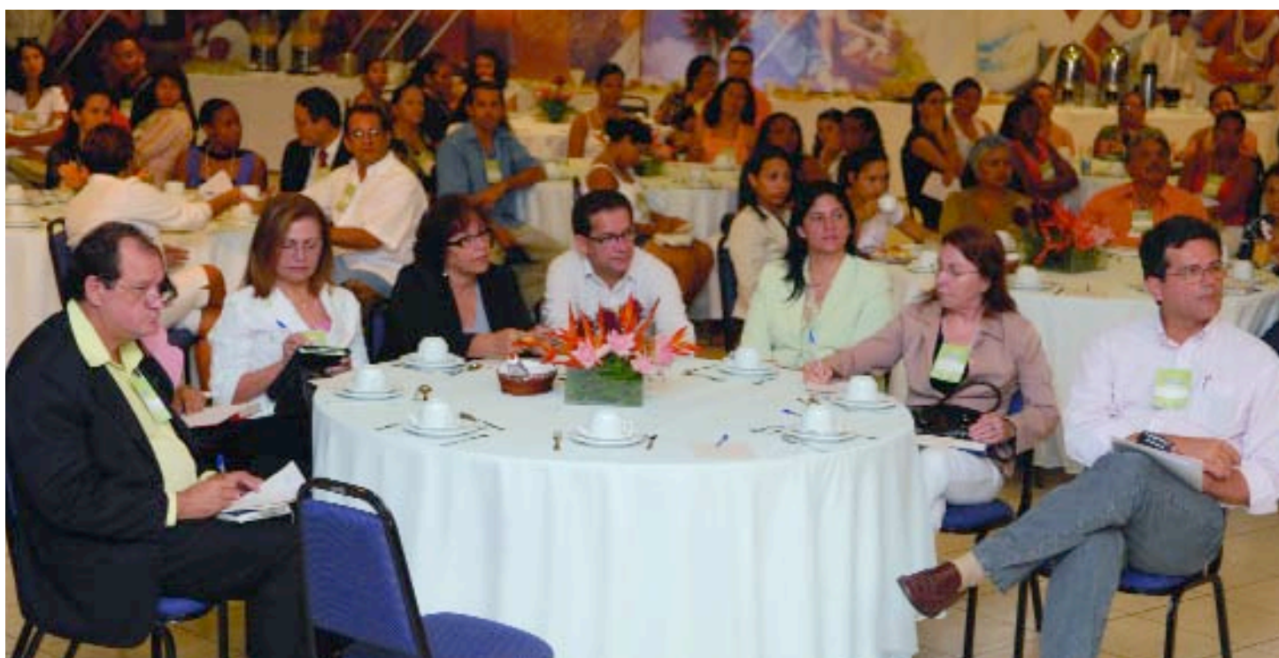
› VOLUNTARIADO EM PAUTA | Mais de cem participantes estiveram presentes no encontro

Vale ressaltar também o trabalho do Conselho Consultivo Comunitário de revitalização do Parque do Bom Menino, que passava por problemas em razão da falta de manutenção do local. Hoje, o parque é uma importante área de lazer para a população de São Luís.