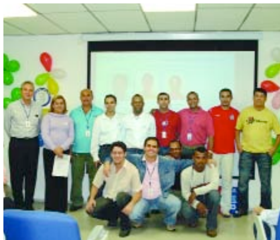
> ALCOA CSI ALPHAVILLE

Com a participação de cerca de quatro mil colaboradores nos Programas BRAVO! e BRAVO! Brasil de 2006, todas as unidades da Alcoa no País entregaram em Abril e Maio os cheques às instituições beneficiadas. No total, foram mais de R$ 2 milhões distribuídos a 629 entidades.