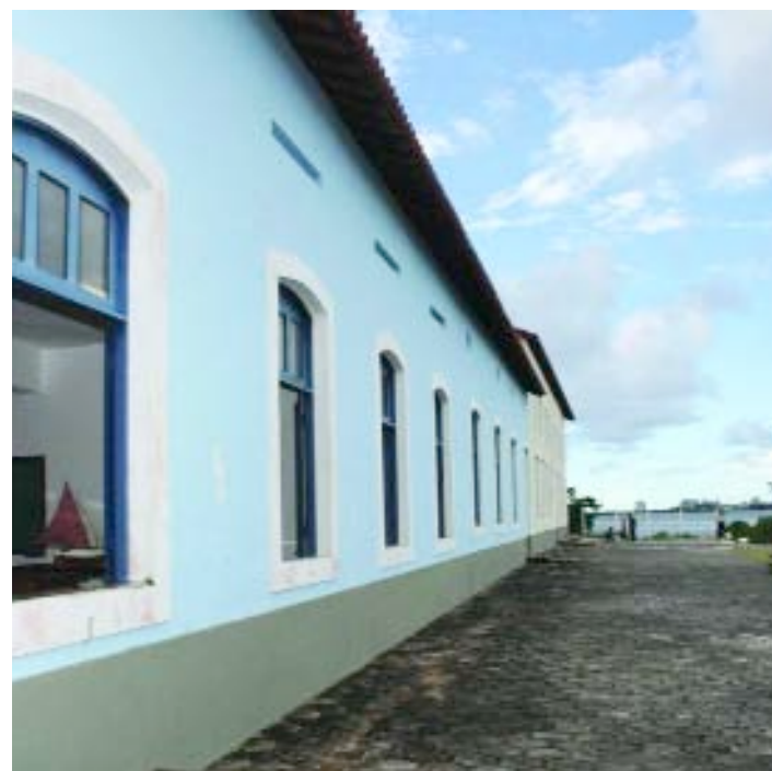
> OFICINA | Vista externa do Estaleiro-Escola