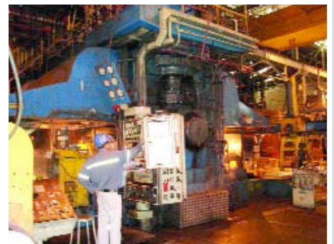
> KAIZEN BLITZ | Parada rápida para melhoria

O Kaizen Blitz é uma ferramenta de melhoria focada, na qual muitas ações relacionadas a uma determinada perda são implantadas, trazendo resultados imediatos. Propicia interação entre os participantes, criando dentro da organização um senso de cooperação e trabalho em equipe, com o intuito de contribuir com a melhoria dos processos e seus resultados.