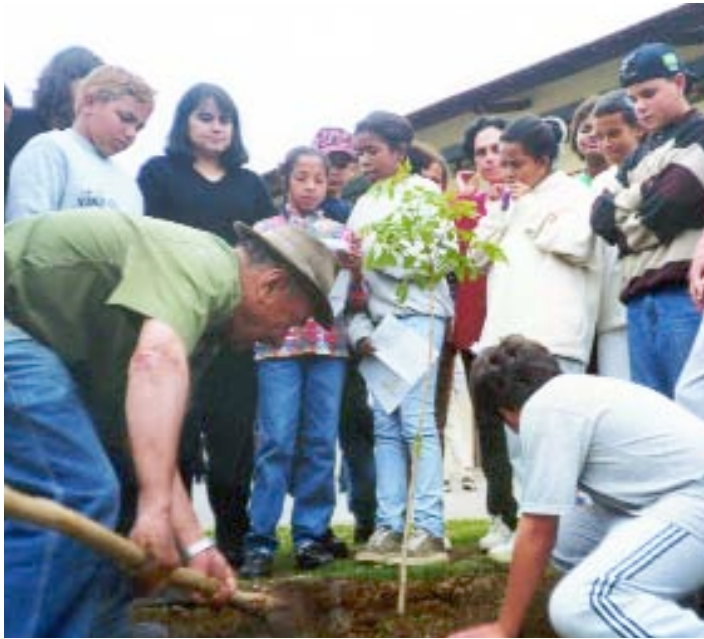
› AFL E POÇOS DE CALDAS | Alcoanos comprometidos com a meta de Dez Milhões de Árvores

Em 1998, a Alcoa incentivou seus funcionários a plantar em todo o mundo um milhão de árvores até 2008. Cinco anos depois, a meta foi cumprida. A Empresa, então, ao perceber o sucesso da iniciativa, pensou em um desafio maior, lançando, assim, o Programa Dez Milhões de Árvores. Por meio dele, a Alcoa estimula o plantio, reconhece e conta as árvores plantadas nas Unidades ao redor do mundo. O Programa é aberto a todos os Alcoanos, contratados, fornecedores e suas famílias para que a meta de dez milhões de árvores – que podem absorver mais de 250 mil toneladas de dióxido de carbono por ano – possa ser atingida em 2020.