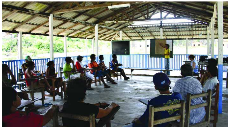
PRIMER PASO | Diagnóstico participativo con la comunidad

MEJORA | Foro Comercial y Reunión de Marketing y Ventas