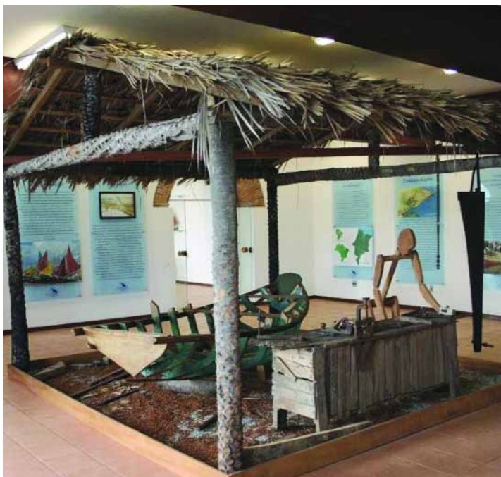
➤ SALA ESPECIAL | Local que ilustra los orígenes del arte del Estado de Maranhão