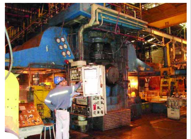
➤ KAIZEN BLITZ | Parada rápida para mejora

El Kaizen Blitz es una herramienta de mejora enfocada, en la cual se implantan muchas acciones relacionadas a una determinada pérdida, proporcionando resultados inmediatos. Proporciona interacción entre los participantes, creando dentro de la organización un sentido de cooperación y trabajo en equipo, con el objetivo de contribuir para la mejora de los procesos y sus resultados.