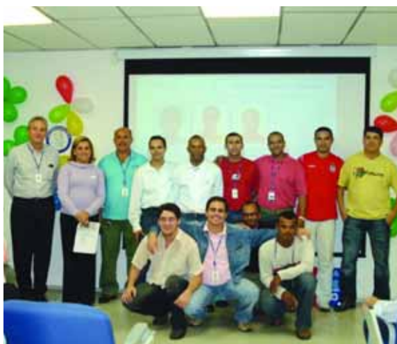
> ALCOA CSI ALPHAVILLE

Con la participación de casi cuatro mil colaboradores en los Programas ¡BRAVO! y ¡BRAVO! Brasil de 2006, todas las unidades de Alcoa en el País entregaron en abril y mayo los cheques a las instituciones beneficiadas. En total, fueron más de R$ 2 millones distribuidos a 629 entidades.