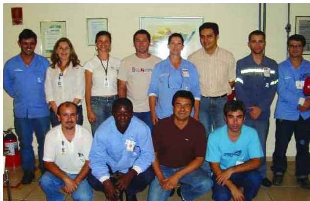
➤ POÇOS DE CALDAS | Grupo de capacitación del Pensamiento A3