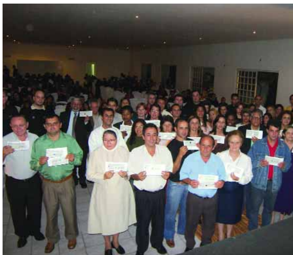
> AFL DO BRASIL