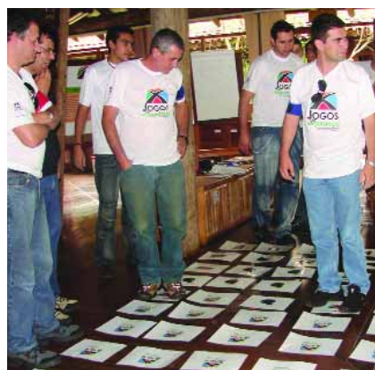
➤ PARTICIPANTES | Una de las actividades desarrolladas en el programa