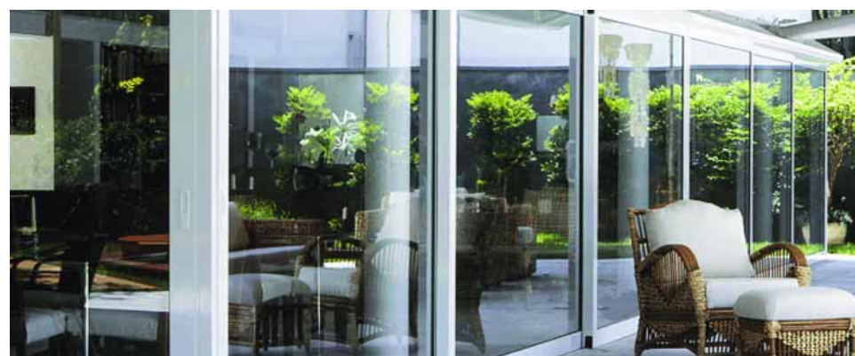
➤ ACABADOS | Perfiles pintados en obras de construcción civil