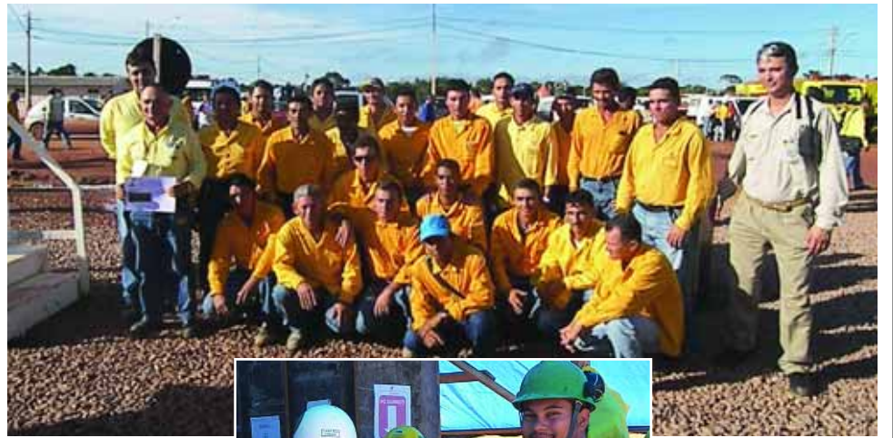
➤ CAMPEONES | Equipo Vencedor del Camino de Excelencia