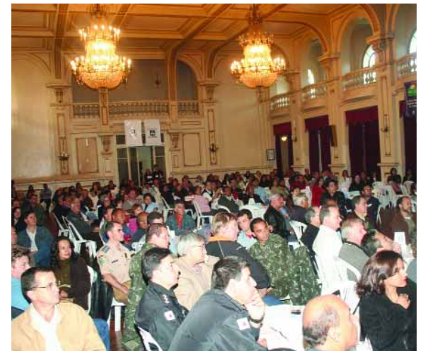
> POÇOS DE CALDAS