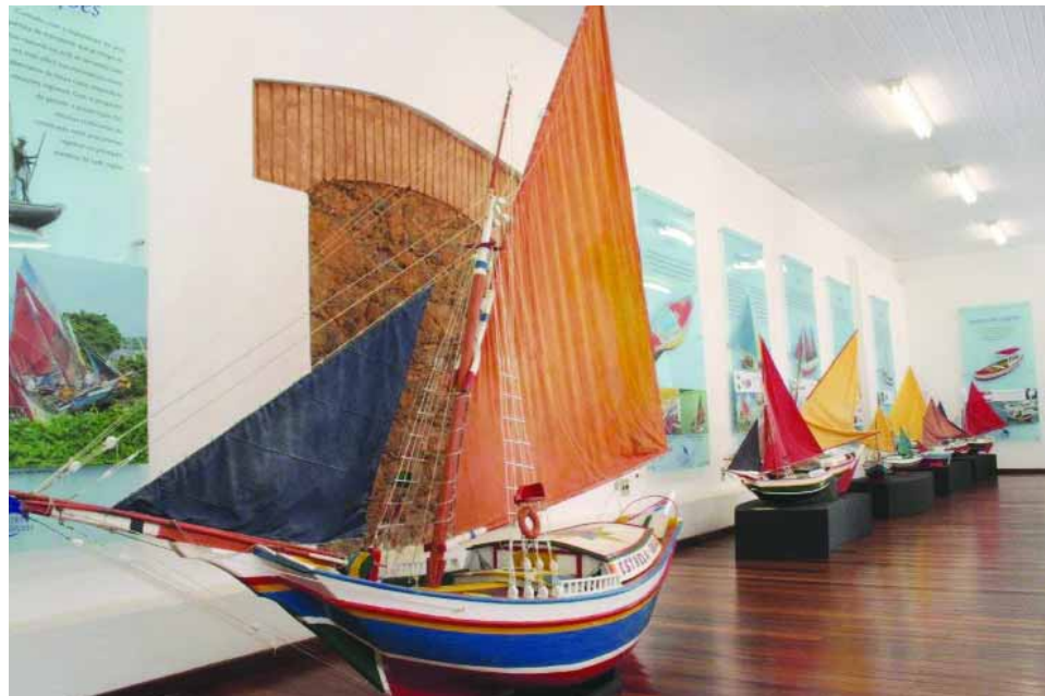
➤ HISTÓRIA | Réplicas de embarcaciones en el museo del CVT-Centro Vocacional Tecnológico

Además de las actividades educativas, el Astillero es uno de los puntos turísticos más nuevos de la ciudad de São Luís. Con un rico acervo arquitectónico, el CVT tiene un museo con libros, herramientas, vinculadas al arte naval del estado de Maranhão y réplicas de embarcaciones.