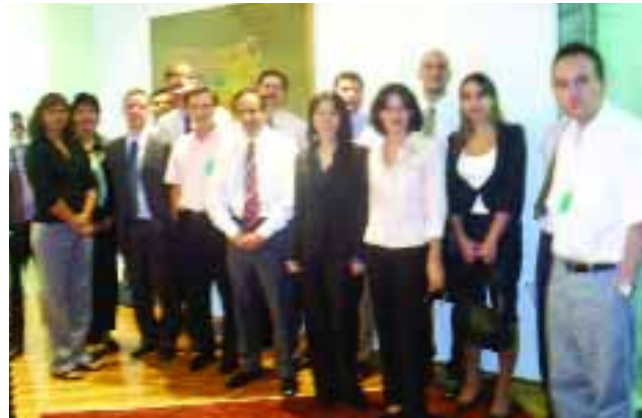
ESTRATEGIA | Equipo de ventas y marketing de Alcoa América Latina

MEJORA | Foro Comercial y Reunión de Marketing y Ventas