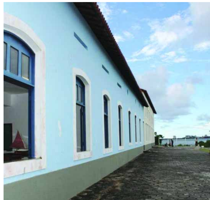
➤ TALLER | Vista externa del Astillero-Escuela

➤ ALUMAR Y LA UFCG-UNIVERSIDAD FEDERAL DE CAMPINA GRANDE | Reutilización de co-producto fino de carbón