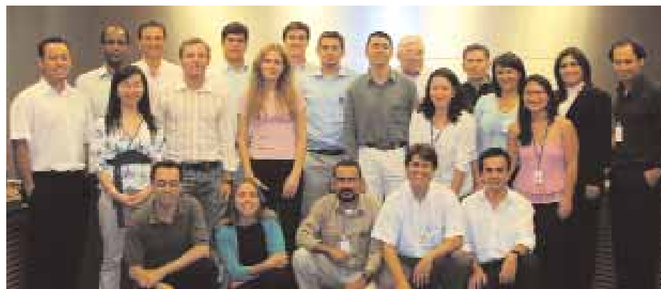
► CAPACITACIÓN INTENSIVA | Equipo recibe informaciones en São Paulo ...

Representantes de las Localidades asistieron a clases teóricas y realizaron ejercicios prácticos, cuando pudieron aclarar las dudas. Este aprendizaje se retransmitirá a cada Unidad, preparándolas para las auditorías