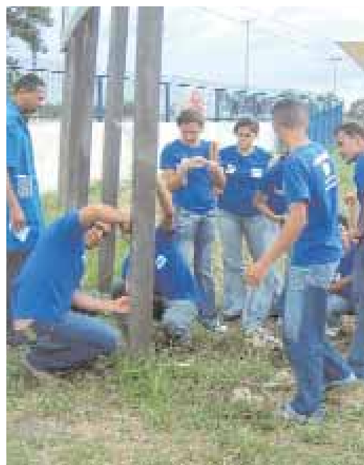
► HABILIDADES | Clases prácticas

Esta capacitación aumentará las probabilidades de los alumnos en el mercado de trabajo y permitirá que sus nombres sean registrados en un banco de datos que estará a disposición de todas las empresas.