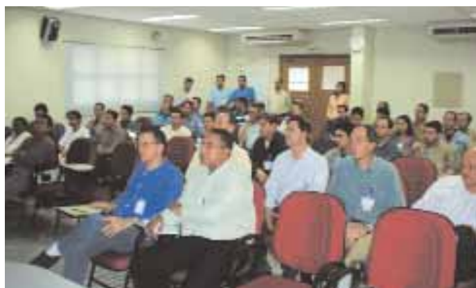
► ALINEACIÓN | Representantes con el liderazgo de Poços

E valuar y validar propuestas de los nuevos estándares establecidos por los secretarios de TPM Primarios. Ese fue el objetivo del taller integrado, realizado en Poços de Caldas. Dirigido por los secretarios de TPM de Primarios de las Unidades de Poços de Caldas y Alumar, el evento contó con la participación de 42 personas, entre representantes de ambas localidades y liderazgos de Poços.