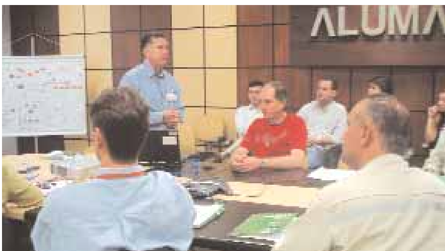
► ... y también en Alumar