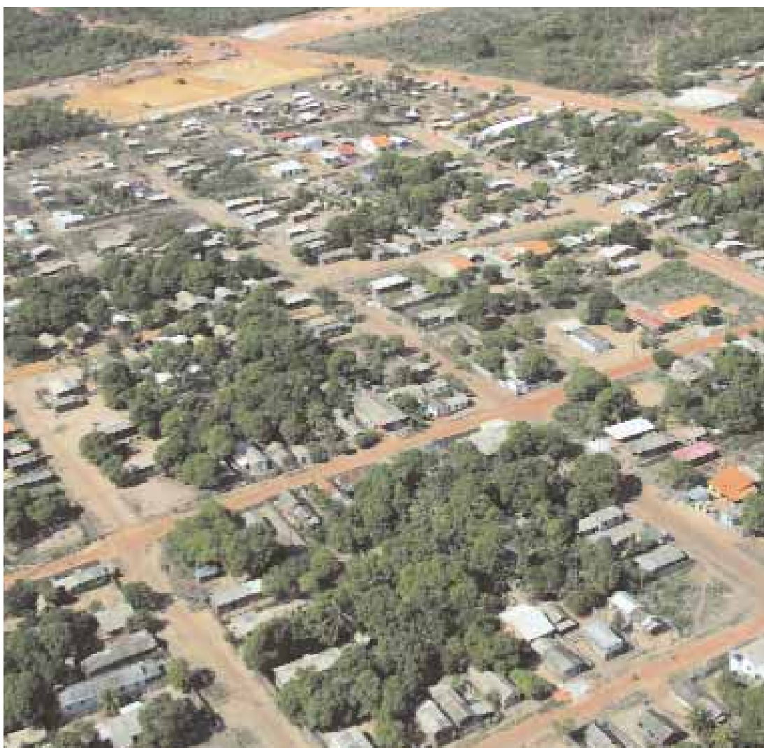
► JURUTI | Parte del área urbana

Esta Agenda reúne compromisos voluntarios asumidos por Alcoa en alianza con la Municipalidad de Juruti, otras instituciones y la comunidad. Entre ellos está la construcción de la escuela definitiva del SENAI-Servicio Nacional de Aprendizaje Industrial en Juruti, un nuevo hospital en la ciudad, además de Unidades Básicas de Salud en los barrios Maracanã y Palmeiras, Casas Familiares Rurales en las comunidades de Juruti Velho, São Benedito y Batata y mejoras en carreteras de algunas de las más importantes comunidades rurales de la región. También incluye el manejo y conservación de quelonios de la región. También forman parte de la Agenda Positiva el apoyo a la manifestación cultural del Festival de las Tribus Indígenas de Juruti y otras acciones voluntarias en beneficio de la comunidad.