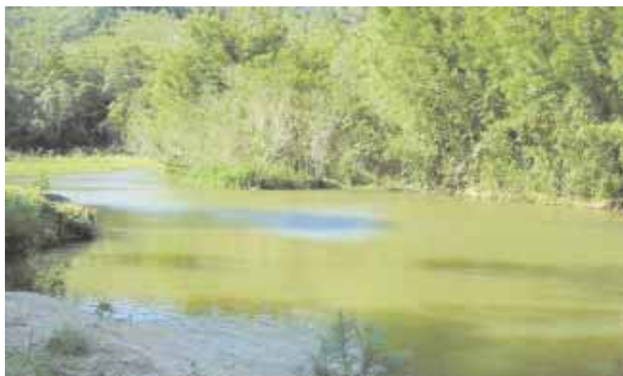
› REPRESA | Preservación de la reserva ambiental