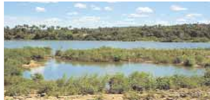
► CONSTRUCCIÓN | Estreito (arriba) y Serra do Facão