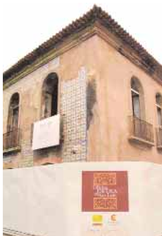
CENTRO AZULEJADO | Restauración externa e interna (al lado)

SÃO LUÍS | Taller Escuela de Restauración