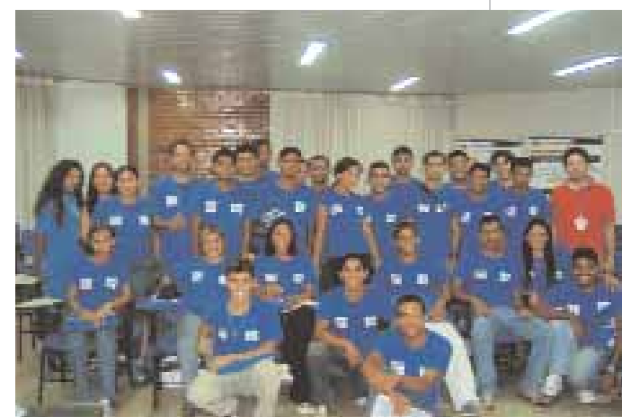
► EQUIPO | Expectativas superadas