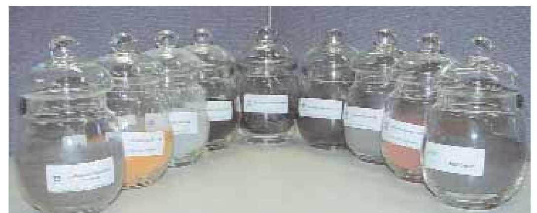
› CO-PRODUCTOS | Artículos reciclados y reaprovechados

por el Área de Aplicaciones y Desarrollo, cuenta con profesionales que reconocen el mérito de la Sustentabilidad, preservación del ambiente y reutilización de materiales. Ellos estudian y transmiten ese conocimien-