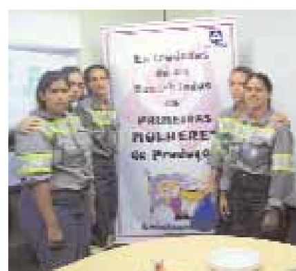
➤ UN PASO MÁS | Proceso de integración femenina