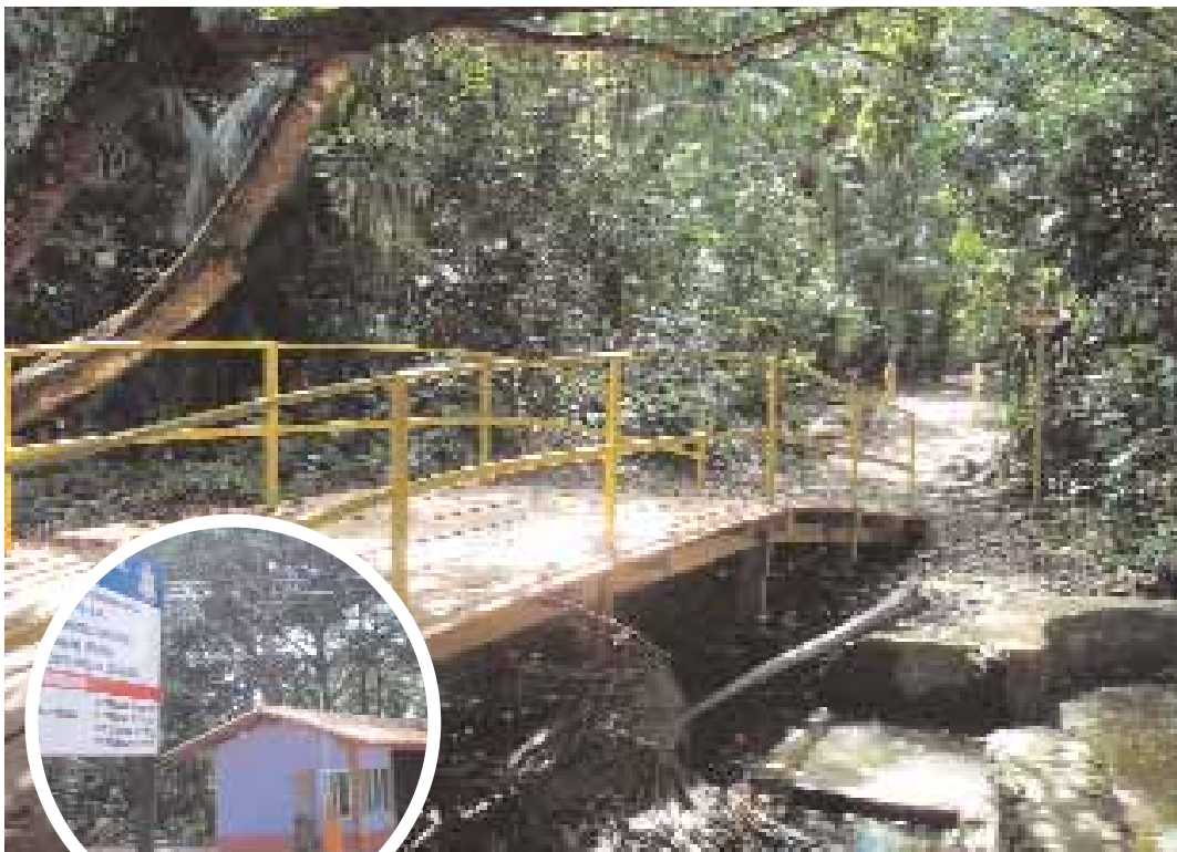
› ITAPIRACÓ | Reserva asegura recarga de aguas

› Sistema nacional de las unidades de conservación (SNUC) Se trata del destino del Fondo de Compensación Ambiental del proyecto.