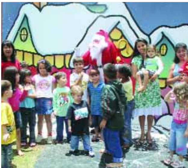
› POÇOS DE CALDAS