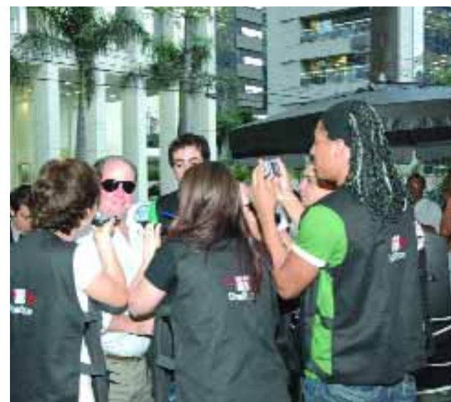
› SÃO PAULO