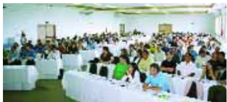
> REUNIÃO | Líderes da Unidade de Poços de Caldas