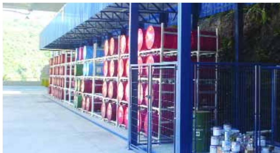
➤ ARMAZENAGEM ADEQUADA | Lubrificantes e produtos inflamáveis

Para os próximos anos a Usina de Machadinho prevê o aperfeiçoamento do SIG com a obtenção das certificações OHSAS 18001 e SA 8000, que padronizam o Sistema de Gestão de Saúde e Segurança e o Sistema de Gestão da Responsabilidade Social, respectivamente.