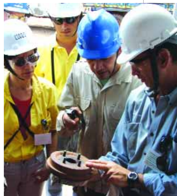
> AVALIAÇÃO | Auditores na área da Base Capiranga