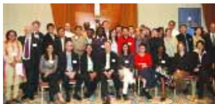
> RELACIONAMENTO | Bolsistas brasileiros, representantes da Alcoa e das Universidades participantes

Uma conferência mundial para disseminação de informações sobre Conservação e Sustentabilidade, organizado pela Alcoa Foundation, foi realizada em Bruxelas, na Bélgica, no final do ano passado. Intitulada Conservation and Fellowship Sustainability Program , reuniu mais de 130 convidados de vários países, inclusive o Brasil, entre Alcoanos e membros do Conselho de Administração da Fundação Alcoa, parceiros acadêmicos, profissionais, organizações não-governamentais, representantes do governo e diplomatas. O principal objetivo foi fortalecer o relacionamento entre a Alcoa e entidades e criar uma rede ativa entre os parceiros acadêmicos e profissionais sobre pesquisas e resultados alcançados. “Com o