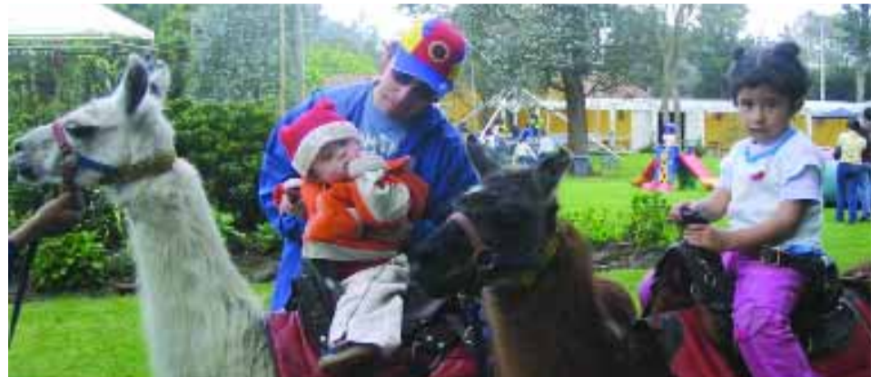
ALCOA CSI VENEZUELA E COLÔMBIA | Festa infantil com filhos e famílias de funcionários em um parque da cidade

As congratulações para as Unidades não estão restritas ao aniversário, mas estendem-se as conquistas essenciais para a Alcoa.