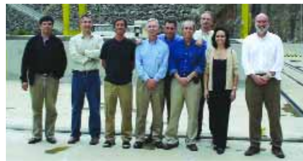
> ACOMPANHAMENTO | Visitantes da Alcoa na Usina com representantes da Direção da Hidrelétrica

Em Novembro, presidente, diretores e membros do Instituto Alcoa visitaram as comunidades rurais próximas à Usina de Barra Grande, localizada no Rio Pelotas, entre os municípios de Anita Garibaldi-SC e Pinhal da Serra-RS. Um dos objetivos foi conhecer os benefícios concedidos às famílias e a forma de organização e de relações das comunidades rurais. Na oportunidade foram visitados os municípios de Esmeralda e Pinhal da Serra, no Rio Grande do Sul; e, em Santa Catarina, os municípios de Anita Garibaldi e Campo Belo do Sul.