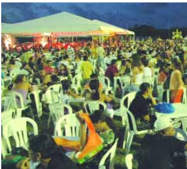
› SÃO LUÍS