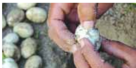
> EDUCAÇÃO AMBIENTAL | Tracajás e pitiús são monitorados antes da soltura