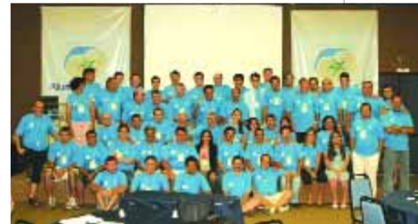
PARTICIPANTES | Rede Alumínio & Cia e equipe Alcoa reunidos

No encontro foram apresentadas as ações realizadas em 2006 e os resultados atingidos. A ocasião também serviu para a rede Alumínio & Cia determinar qual