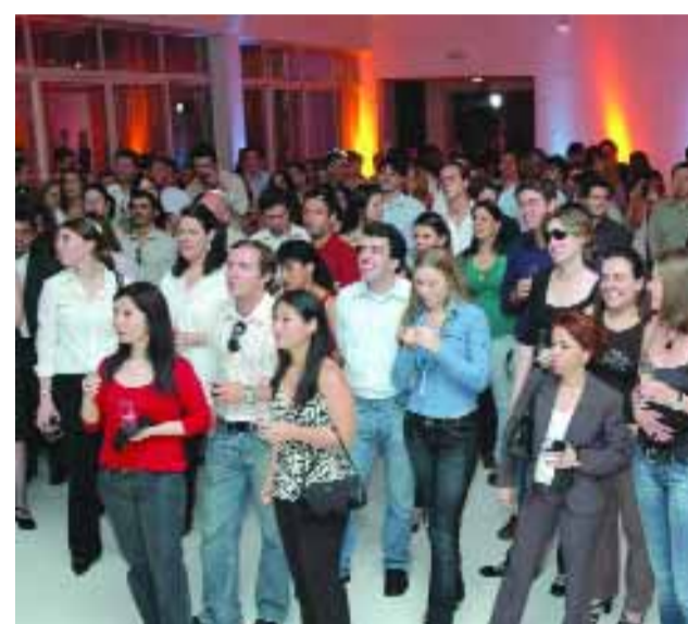
› SÃO PAULO

Nos dias 18 e 20 de Dezembro a CSI Alphaville proporcionou a seus funcionários duas noites de jantar na churrascaria Novilho de Prata, em São Paulo.