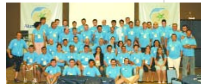
> PARTICIPANTES | Red Aluminio & Cia y equipo Alcoa reunidos

Durante el encuentro se presentaron las acciones realizadas en 2006 y los resultados alcanzados. La ocasión también sirvió para