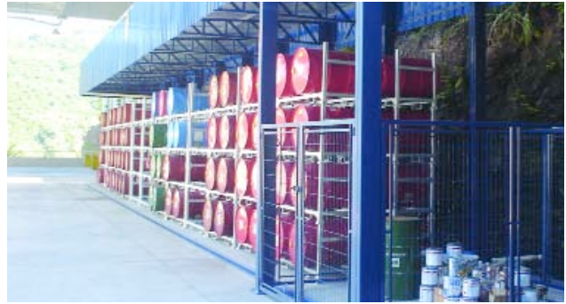
➤ ALMACENAMIENTO ADECUADO | Lubricantes y productos inflamables

vo desde 2002, cuando comenzó el proceso de implantación del Sistema Integrado de Gestión de la Calidad y del Medioambiente (SIG). Para los próximos años, la Usina de Machadinho tiene previsto el perfeccionamiento del SIG con la obtención de las certificaciones OHSAS 18001 y SA 8000, que estandarizan el Sistema de Gestión de Salud y Seguridad y el Sistema de Gestión de la Responsabilidad Social, respectivamente.