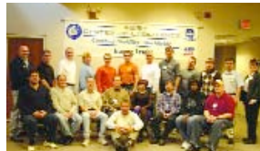
➤ SIETE HERRAMIENTAS | Capacitación en el Centro de Excelencia Alcoa