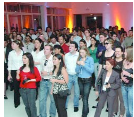
&gt; SÃO PAULO

Unidades de Alcoa realizan animados eventos para conmemorar el nuevo año