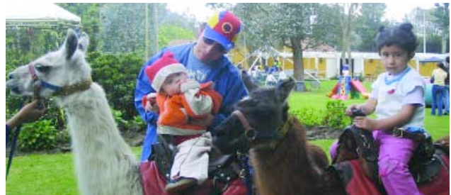
> ALCOA CSI VENEZUELA Y COLOMBIA | Fiesta infantil con hijos y familias de empleados en un parque de la ciudad.

Nuestras felicitaciones para las Unidades no se limitan a la fecha de su aniversario, sino que incluyen todas las conquistas por ellas realizadas y que son esenciales para Alcoa.