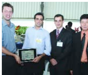
CERTIFICACIÓN | Profesionales de Alcoa y representantes de la empresa NGK/NTK durante el workshop

Durante el Taller de Productos y Proveedores de Alto Impacto de NGK/NTK, en el que Alcoa fue invitada a participar, se entregó un certificado de reconocimiento por el hecho de que la Empresa es considerada un futuro proveedor de alto impacto de NGK.