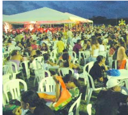
&gt; SÃO LUÍS