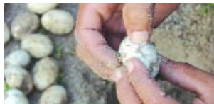
> EDUCACIÓN AMBIENTAL | Tracajás y pitiús son fiscalizados antes de soltarlos