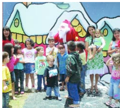
&gt; POÇOS DE CALDAS