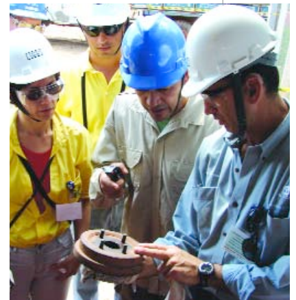
> EVALUACIÓN | Auditores en el área de la Base Capiranga