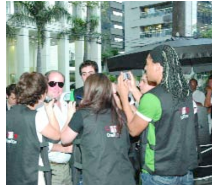
&gt; SÃO PAULO