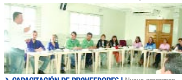
➤ CAPACITACIÓN DE PROVEEDORES | Nueve empresas conocieron los conceptos de ABS en el Simposio para proveedores

La Unidad de Poços de Caldas realizó un evento en el mes de diciembre, con el objetivo de incentivar a las empresas proveedoras a que incorporen y practiquen los conceptos de ABS.