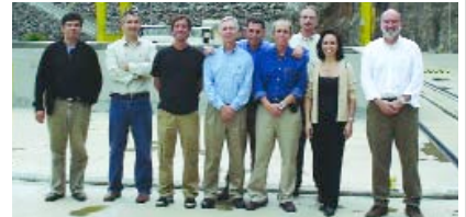
> ACOMPAÑAMIENTO | Visitantes de Alcoa en la Usina con representantes del Directorio de Hidroeléctrica

E n noviembre, el presidente, directores y miembros del Instituto Alcoa visitaron las comunidades rurales próximas a la Usina de Barra Grande, localizada en el Río Pelotas, entre los municipios de Anita Garibaldi, estado de Santa Catarina, y Pinhal da Serra, Estado de Rio Grande do Sul. Uno de