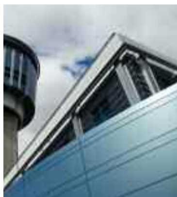
● A torre de controle do aeroporto de LaGuardia é revestida com Reynobond