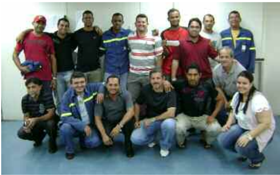
● Parte da equipe, entre operadores e profissionais de Manutenção de Itapissuma, que participou do treinamento Book de Defeitos .

Aproximadamente 50 pessoas da Unidade de Itapissuma, entre elas operadores e profissionais de Manutenção, participaram do treinamento Book de Defeitos . A ideia era capacitar os funcionários na identificação e correção dos principais defeitos por qualidade ocorridos na refusão do alumínio.