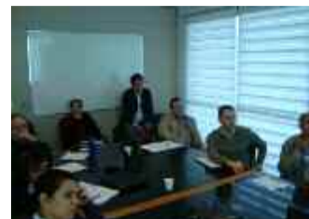
● Equipe técnica do mercado de construção civil participa da capacitação

com o objetivo de manter o corpo técnico da Alcoa alinhado à estratégia da Rede Alumínio & Cia.