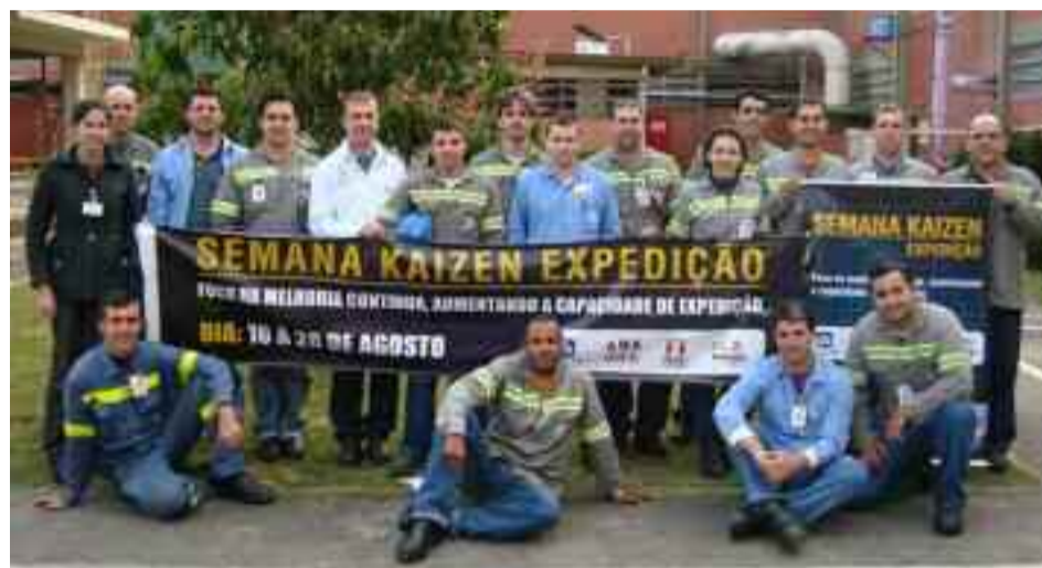
● Grupos de Equipamentos, Padronização e Fluxo de Tubarão participaram da Semana Kaizen

As melhorias implantadas durante o kaizen foram: a instalação de um toldo automatizado que permite o carregamento sem a interferência do clima, o desenvolvimento de um quadro para organizar e controlar o visual das cargas em processo de faturamento, a definição de uma área exclusiva para paletização de material, a nova demarcação e alteração das faixas de pedestres, auxiliando no fluxo de pessoas, entre outras.