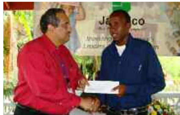
● Jovem da comunidade que abriga as operações da Jamalco recebe bolsa de estudo