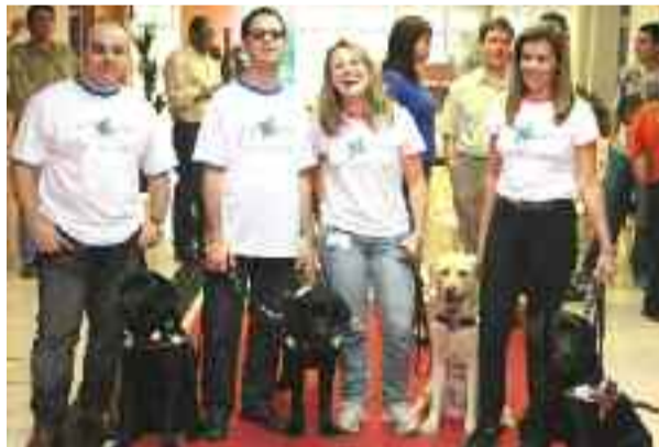
● Instituto Íris esteve presente para o desfile de pessoas com deficiência visual e seus cães-guias