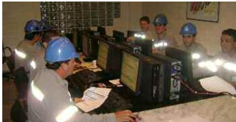
● Funcionários da Unidade de Tubarão respondem à pesquisa de Clima Organizacional “Vozes do Mundo, Uma Empresa”

A pesquisa foi conduzida pela Kennexa, uma consultoria de atuação internacional especializada em pesquisas sobre ambientes de trabalho para grandes empresas. O resumo dos resultados estará disponível a partir de Novembro.