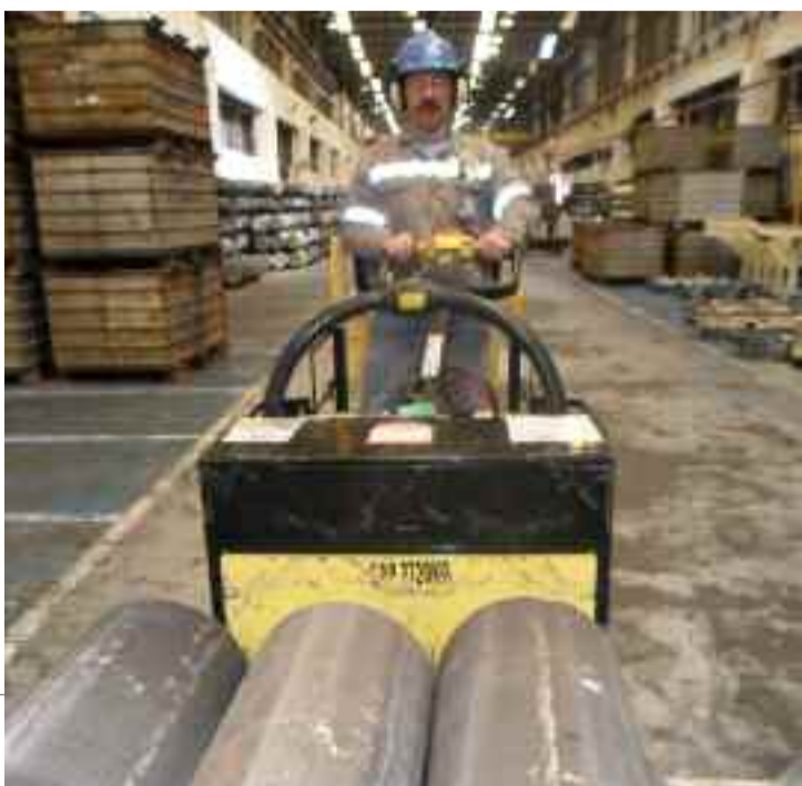
● Paleta elétrica: ampla visibilidade e fácil operação

ligas, além da transferência de 60% das atividades realizadas pelos carrinhos hidráulicos manuais para a paleta elétrica e empilhadeira elétrica, que são equipamentos de menor porte, ampla visibilidade e fácil operação. Com esse kaizen é possível restringir as atividades da empilhadeira mecânica dentro do pátio de tarugos e aumentar a segurança nas situações em que se faz necessária a saída dela.