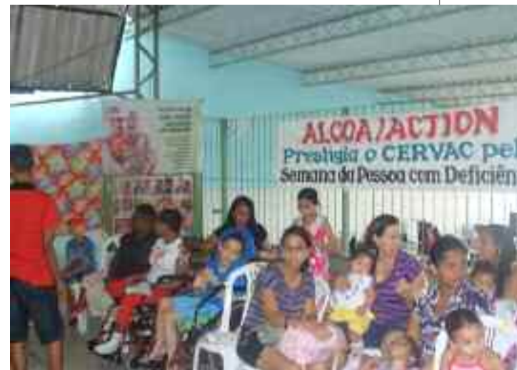
● Membros da comunidade discutem inclusão social durante a Semana da Pessoa com Deficiência, em Recife

A Unidade de Itapissuma participou, em Recife, de diversas atividades que aconteceram no CERVAC-Centro de Reabilitação e Valorização da Criança, durante a Semana da Pessoa com Deficiência, uma iniciativa do Estado de Pernambuco, com o objetivo de debater com a sociedade a questão da inclusão social. Entre Alcoanos, familiares, crianças e jovens atendidos pelo CERVAC, participaram das oficinas e atividades recreativas 120 pessoas.