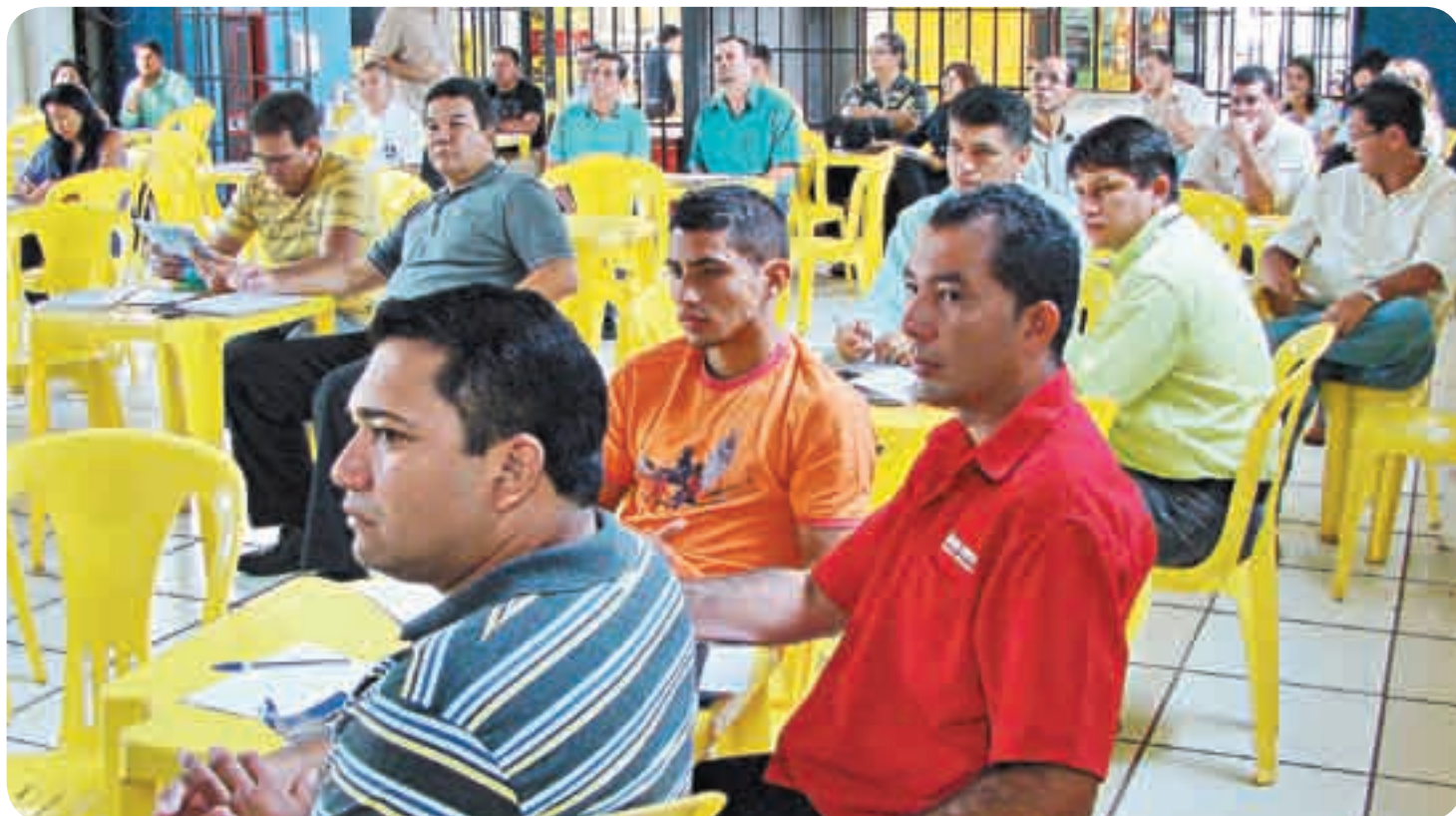
Empresários de Juruti reunidos durante o III Encontro de Negócios: fornecedores e empresas mais fortes e competitivos.