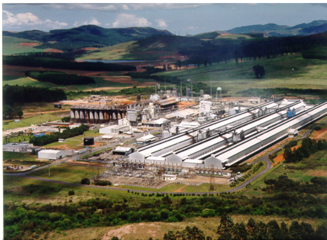
Alcoa Poços de Caldas Aluminium Plant

É parte do processo de redução eletrolítica a ocorrência de fenômenos chamados efeitos anódicos. Esses ocorrem com níveis de frequência e duração que dependem das condições físico-químicas das cubas. Os efeitos anódicos causam consequências indesejáveis. Uma delas é a formação de gases PFC ( CF_4 e C_2F_6 ). Esses gases contribuem significativamente para para o efeito estufa que é objeto de constante preocupação da indústria de alumínio em geral e da Alcoa em particular. Na planta da Alcoa em Poços de Caldas um esforço específico vem sendo feito desde março de 2005 através do “Programa