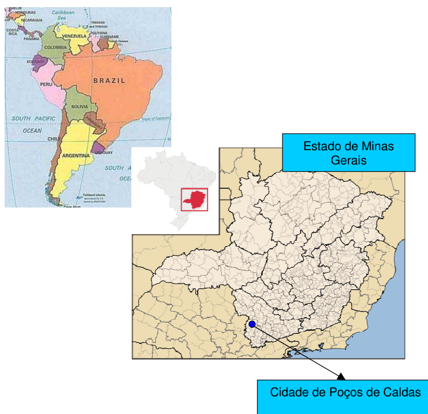
Figura 1: Localização física da atividade de projeto:

Poços de Caldas apresenta o quarto maior Índice de Desenvolvimento Humano (IDH) entre as cidades brasileiras. Atualmente a atividade industrial representa 52,26% das receitas municipais. Alcoa S.A. é a empresa mais importante na cidade com o maior número de empregados (mais de 850). A exata localização da planta de Alumínio da Alcoa é 21°50'27"S e 46°33'21"W. Abaixo a figura da localização física de Poços de Caldas