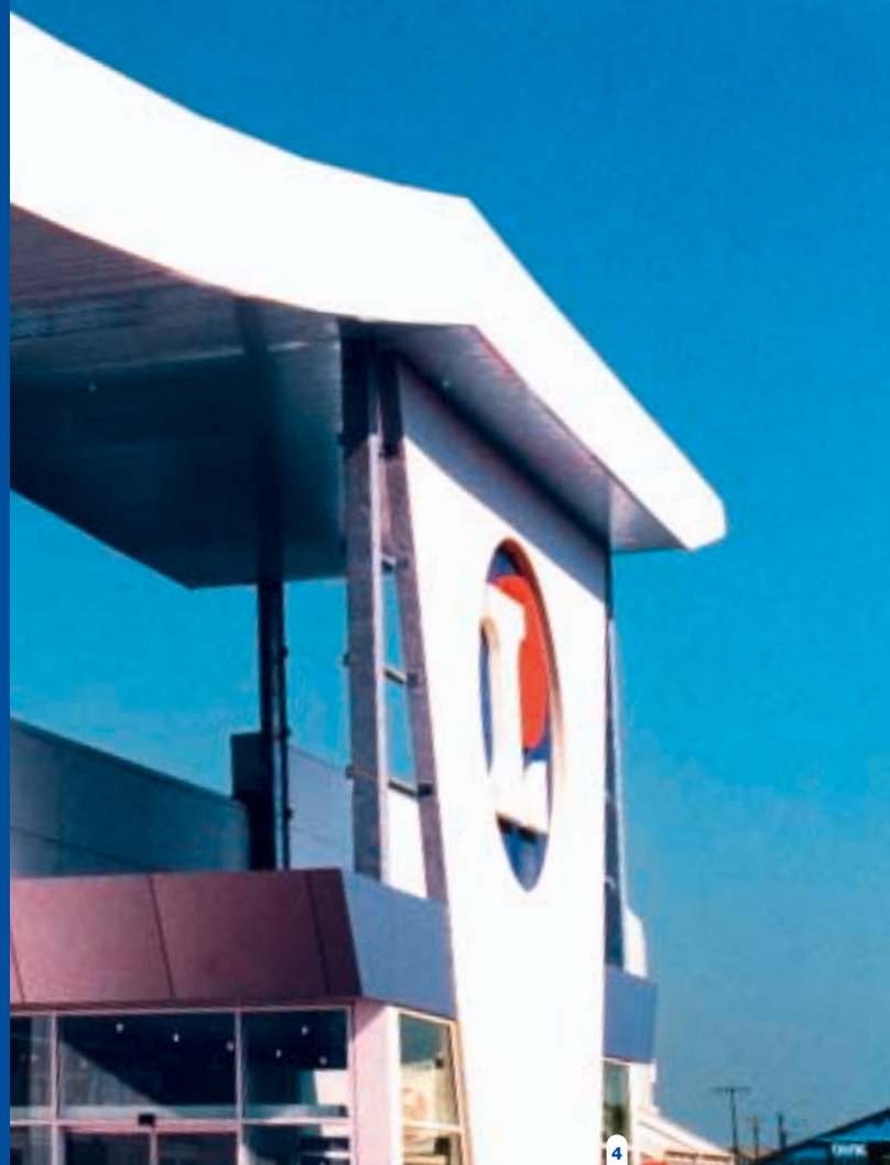
3-4. Centre commercial Leclerc à Morlaix 5. Centre commercial Leclerc à Lamballe

Bien sûr puisque je suis en train de le faire actuellement. Nous avons même réalisé des totems avec du REYNOBOND® pour le centre Leclerc de Lamballe.