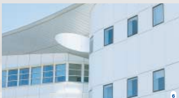
6. Crédit Mutuel, Dijon, France Architecte: DUFAY - SERDAROGLU

Pour vous offrir un service sur-mesure, les panneaux REYNOBOND® 2000 XXL peuvent être produits sur-mesure en différentes longueurs.