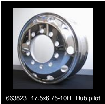
663823 17.5x6.75-10H Hub pilot

大型資材、機械運搬等に使用される特殊低床トレーラー向けのホイールが新開発されました。高まる低床化ニーズと、軸重対策、足回りの熱対策に強い要望があり、今回のリリースとなりました。 本製品は、これから高まる「輸送効率向上」を目的とするトレーラー用としても注目されております。