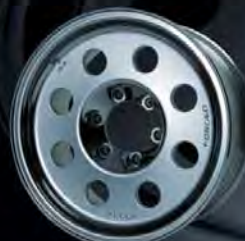
178011 BK 17inch × 8J