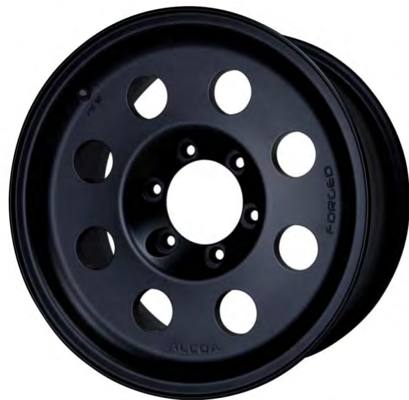
178011 BK (マットブラック)