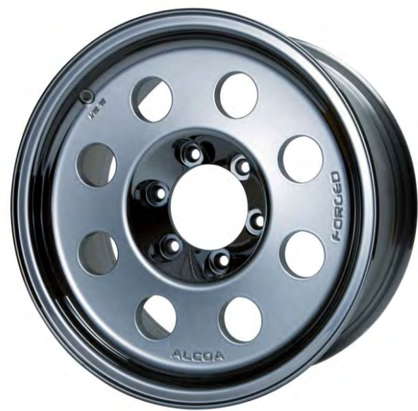
178011 SP (SBCスパッタリング)