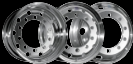
De lichtste en de sterkste

Voor meer informatie : Alcoa Wheel Products Europe Tel. : +32 (0)11 458 465 Fax : +32 (0)11 455 630 info.wheels@alcoa.com