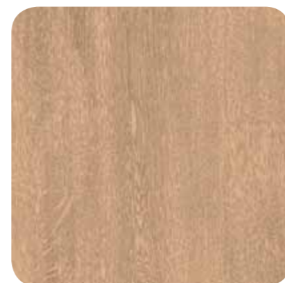
Pale Oak – D 1121 MR