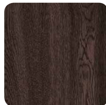
Dark Oak – D 8116 MR