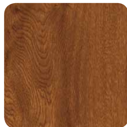
Golden Oak – D 8109 MR