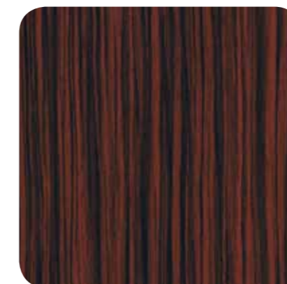
Okene Line – D 8122 MR