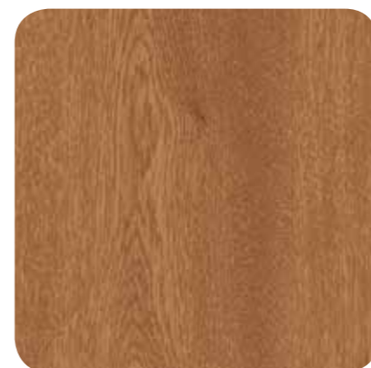
Scottish Oak – D 8115 MR