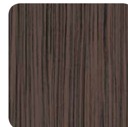
Dark Zebrano – D 8123 MR