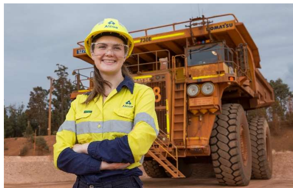
Formandos, Willowdale, Austrália