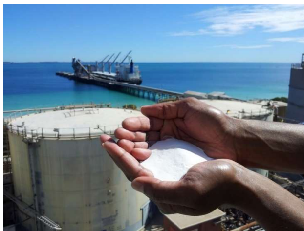
Alumina brilhante, Kwinana, Austrália

Para perguntas gerais sobre os Padrões para Fornecedores da Alcoa, entre em contato pelo e-mail SupplierSustainability@alcoa.com .