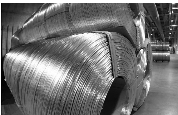
Bobines de fils d'aluminium, Fjaroaal, Islande