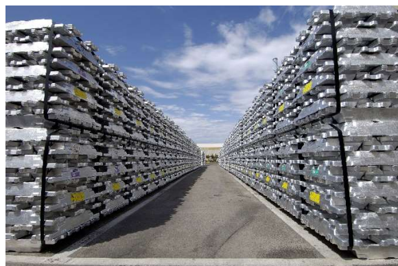
Lingots d'aluminium, Portland Australie